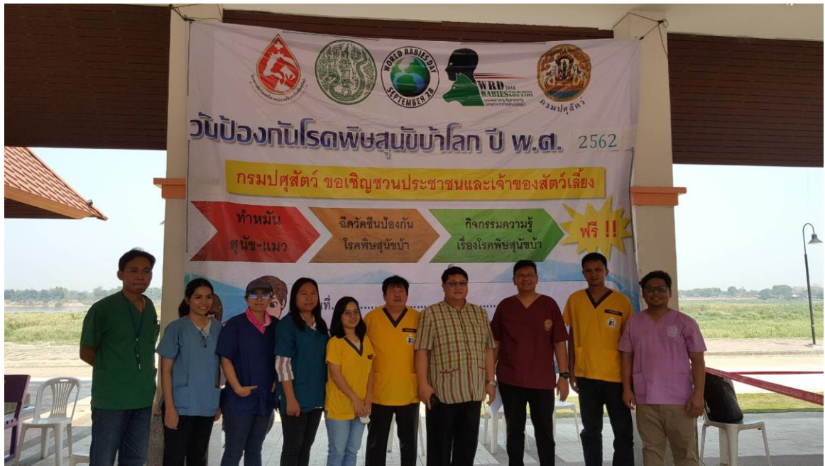
ร่วมงานวันป้องกันโรคพิษสุนัขบ้าโลก จังหวัดสกลนคร