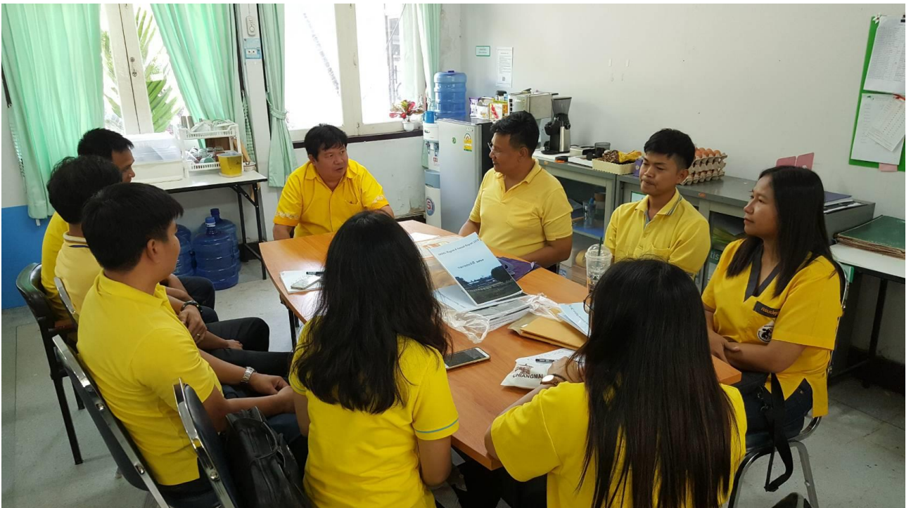
ประชุมติดตามงานและแก้ไขปัญหาอุปสรรคประจำเดือน