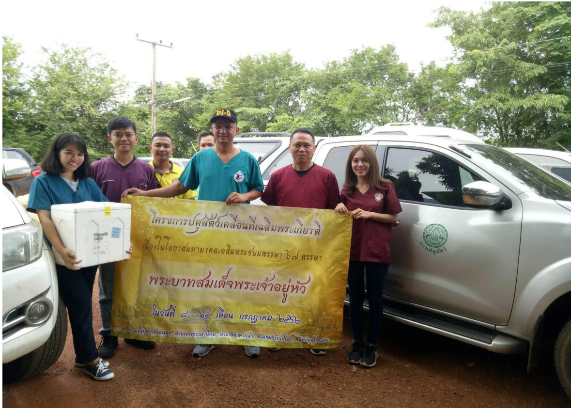
เข้าร่วมโครงการปศุสัตว์เคลื่อนที่เฉลิมพระเกียรติฯ จ.สกลนคร