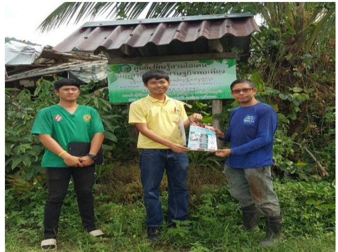
เข้าร่วมดำเนินการเฝ้าระวังเชิงรุก และประชาสัมพันธ์ให้ความรู้เกี่ยวกับโรคอหิวาห์แอฟริกาในสุกร (ASF) ในพื้นที่ จ.เชียงราย