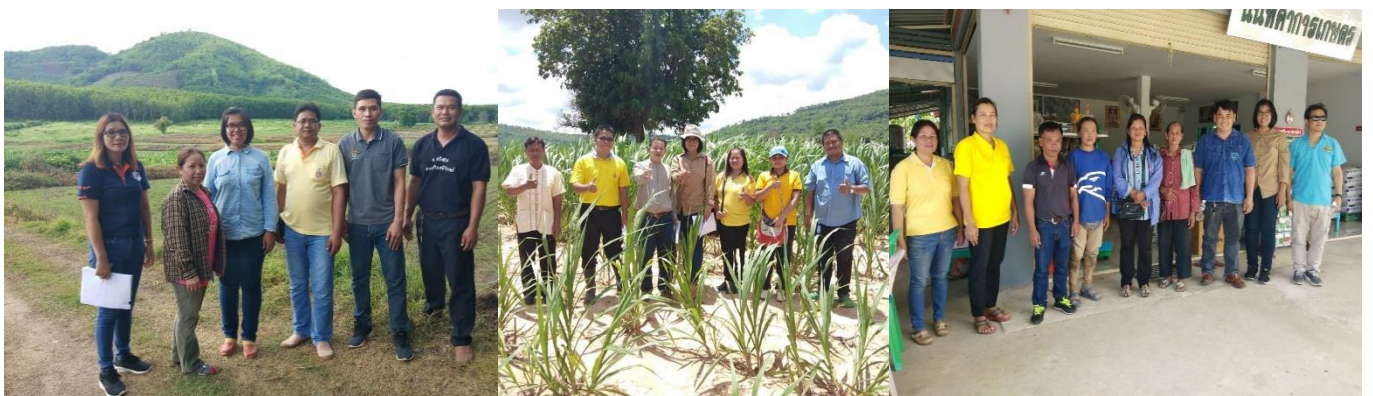
ตารางที่ 3 การดำเนินงานปรับเปลี่ยนพื้นที่สำหรับปลูกพืชอาหารสัตว์