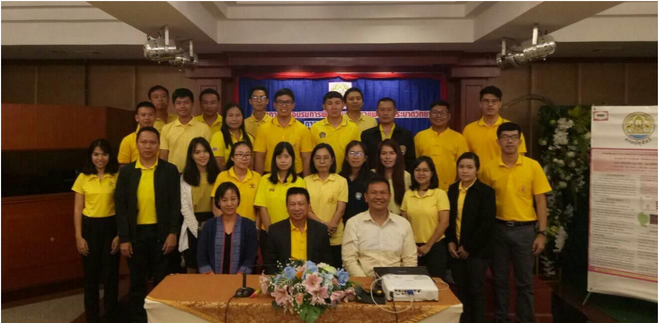
เข้าร่วมอบรมโครงการพัฒนานายสัตวแพทย์นักระบาดวิทยาภาคสนาม ระดับเขต 4 หลักสูตร “การนำเสนอผลงานวิชาการ” จ.ขอนแก่น