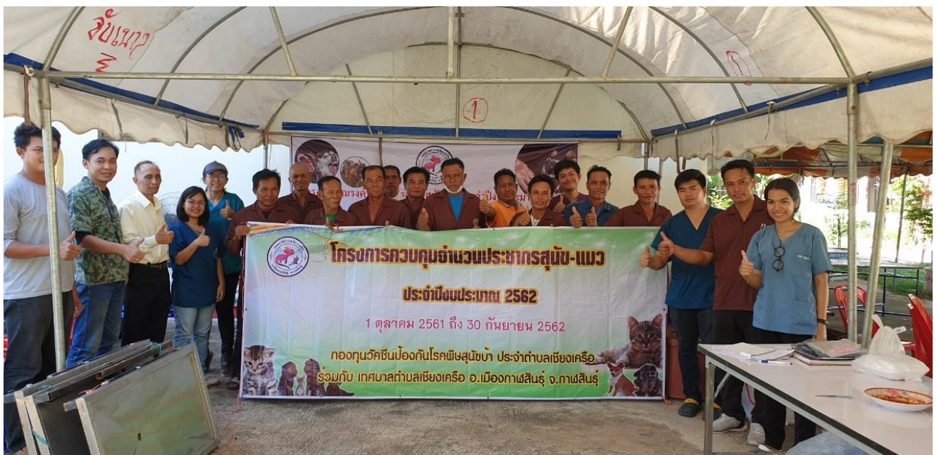
เข้าร่วมโครงการกาฬสินธุ์โมเดล จ.กาฬสินธุ์