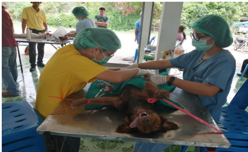
ผ่าตัดทำหมันสุนัขและแมวร่วมกับสำนักงานปศุสัตว์จังหวัดในพื้นที่ปศุสัตว์เขต 4