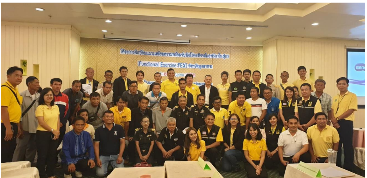
ร่วมกับส่วนสุขภาพสัตว์ สำนักงานปศุสัตว์เขต 4 เป็นวิทยากร Functional Exercise โครงการฝึกซ้อมแผนเตรียมความพร้อมรับมือโรคคอตีบหวัดแอฟริกาในสุกร ในพื้นที่ปศุสัตว์เขต 4