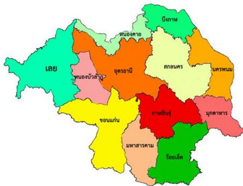
แผนภูมิที่ 2 แสดงอาณาเขตพื้นที่รับผิดชอบของเขต 4

พื้นที่ในความรับผิดชอบของสำนักงานปศุสัตว์เขต 4 ประกอบด้วย 12 จังหวัด ได้แก่ กาฬสินธุ์ ขอนแก่น มหาสารคาม นครพนม มุกดาหาร เลย สกลนคร หนองคาย หนองบัวลำภู ร้อยเอ็ด อุดรธานี และบึงกาฬ ตั้งอยู่ตอนบนของภาคตะวันออกเฉียงเหนือ มีพื้นที่ประมาณ 52.182 ล้านไร่