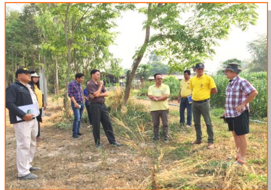
ภาพกิจกรรมตรวจรับรองปศุสัตว์อินทรีย์ ให้คำแนะนำในการแก้ไข