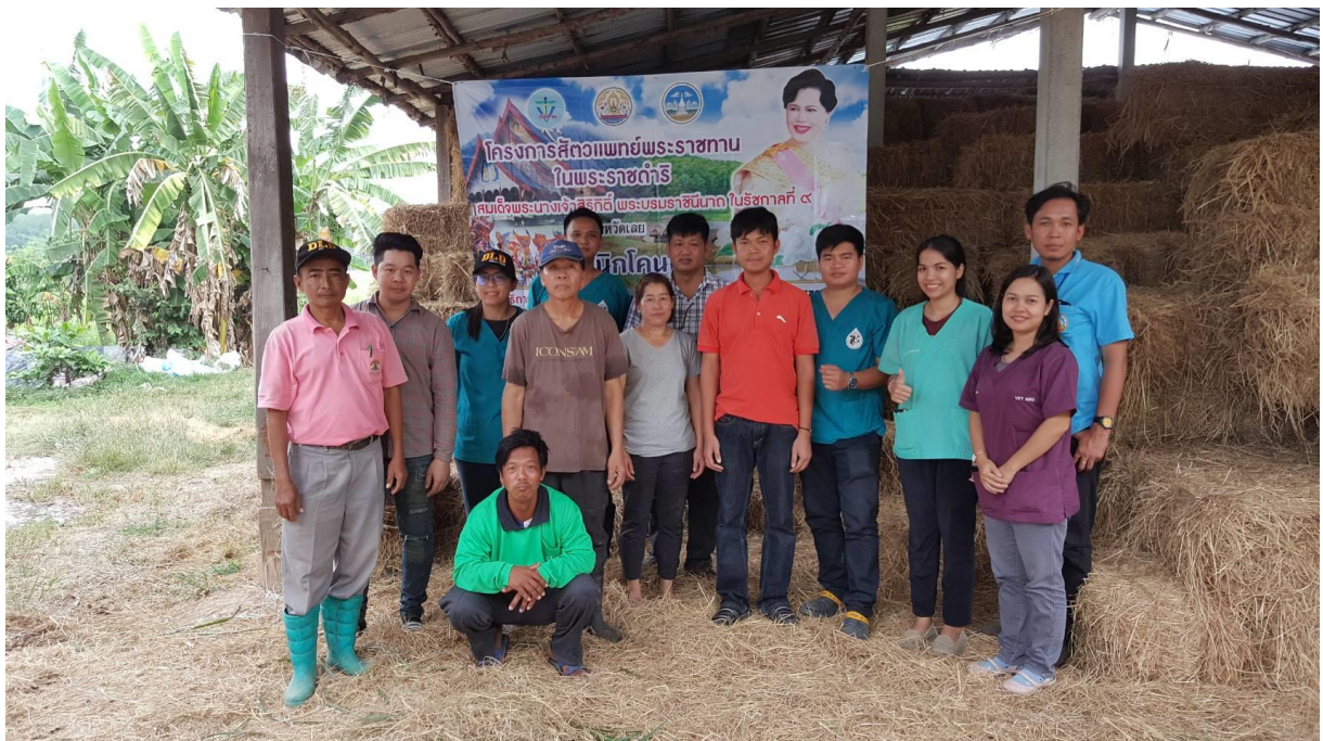
ออกหน่วยโครงการสัตวแพทย์พระราชทาน จ.เลย