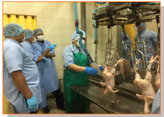
ภาพกิจกรรมตรวจรับรองและตรวจติดตามการรับรองการปฏิบัติทางสุขลักษณะที่ดี สำหรับโรงฆ่าสัตว์ (GMP) ให้คำแนะนำในการแก้ไขปรับปรุงโรงฆ่าสัตว์ (GMP)