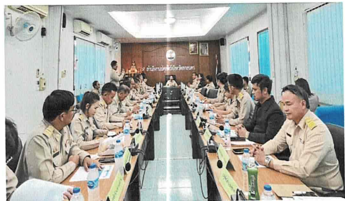
“สกลนครเมืองแห่งความสุข”